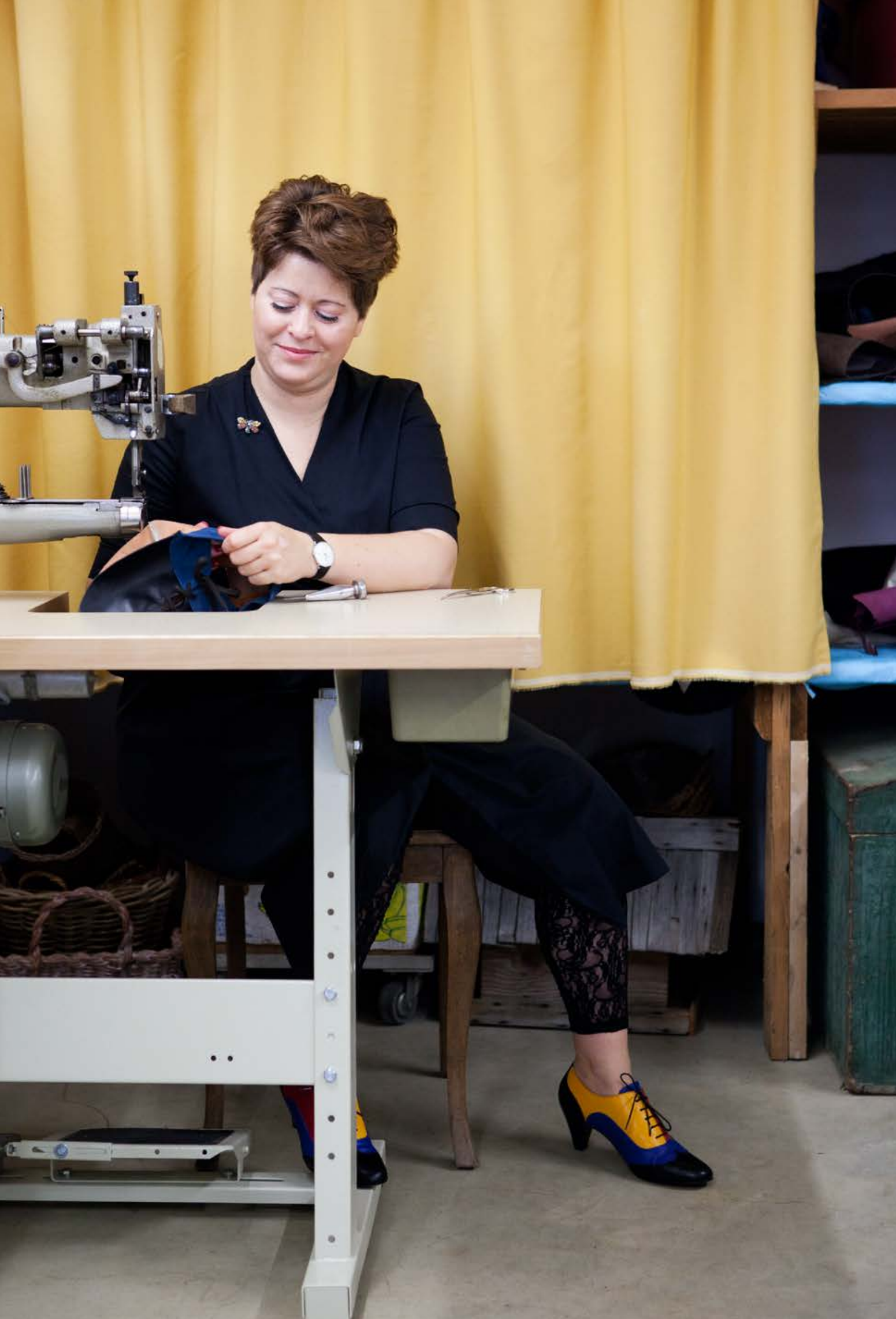
Die Schuhe werden in der Werkstatt in Weinfelden genäht. / The shoes are sewed together at the workshop in Weinfelden Rechts: Intensive Farben – Lager mit diversen Ziegenledern / Right: Intense colors – the storage area with a variety of goatskins