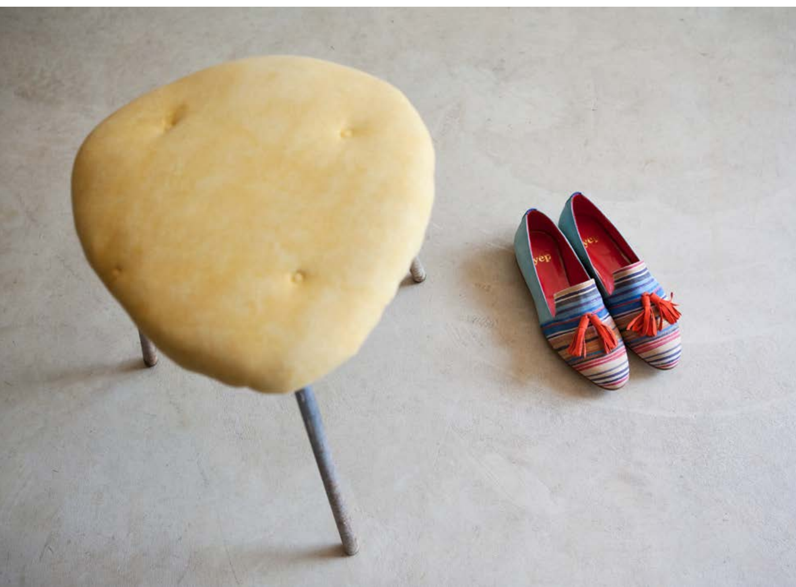
Schuh-Prototyp, Zwickzange zum Ziehen des Schafts über den Leisten, Tackelheber zum Rausziehen der Nägel, Rundhölle und Hammer / Shoe prototype: lasting pincers for pulling the upper over the last; tack puller for pulling out nails; round awl and hammer Modell Palermo multicolore / The "Palermo multicolore" model