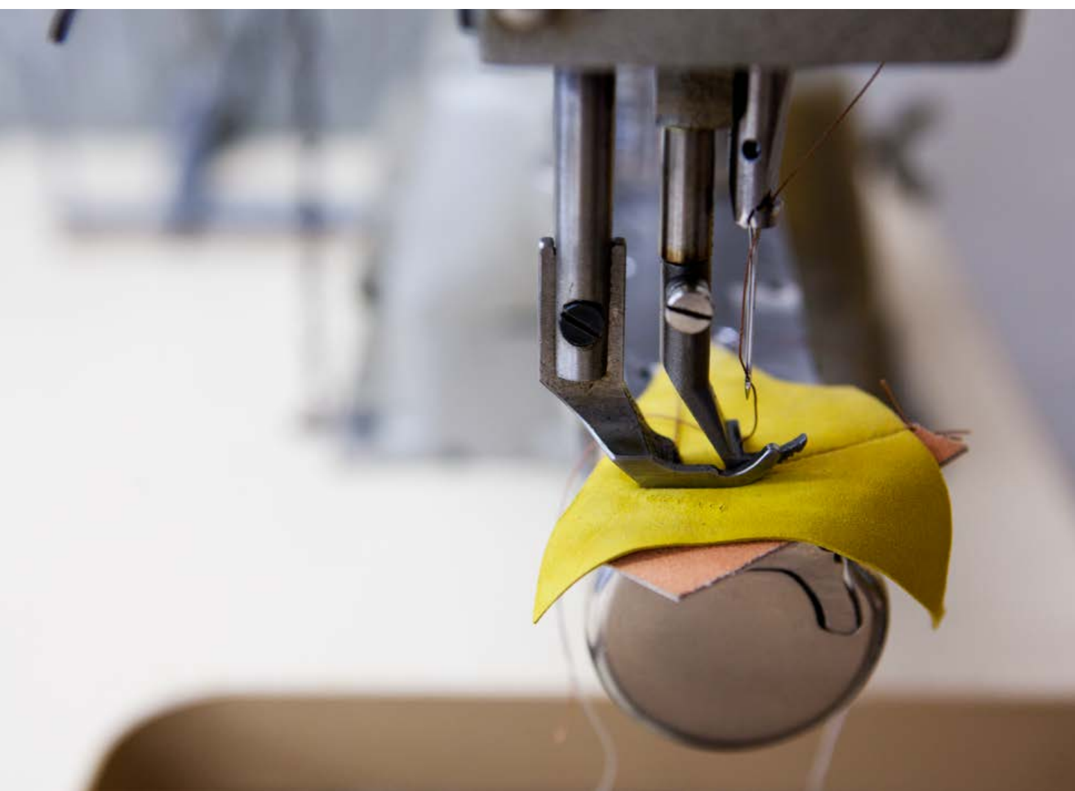
Sohlenfräser und Poliereisen zur Sohlenbearbeitung. Photo: ein rahmengerähter Schuh wird eingestochen / Maschine for trimming and polishing the soles. Photo: a welted shoe is being pierced. Unten: Detail einer Freiarml-Eledernähmaschine / Below: Detail of a free-arm leather sewing machine