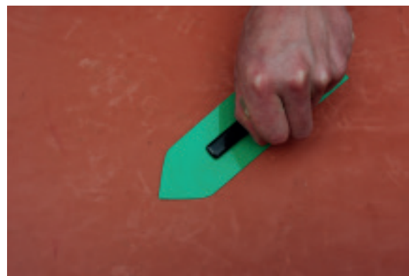
Impressionen aus dem Kurszentrum Ballenberg: Das Kurshaus, Generationenkurs beim Töpfern, Veredeln von Obstbäumen / Impressions du centre de formation de Ballenberg : le bâtiment de cours, les cours intergénérationels de poterie et de greffe d'arbres fruitiers